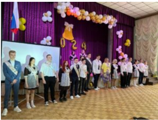
- Выпускной вечер (11 кл)